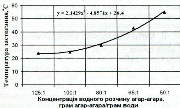
Рис. 2. Залежність температури застигання водного розчину агар-агара від концентрації агар-агара у розчині