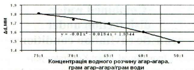
Рис. 3. Залежність різниці діаметрів гранули від концентрації водного розчину агар-агара