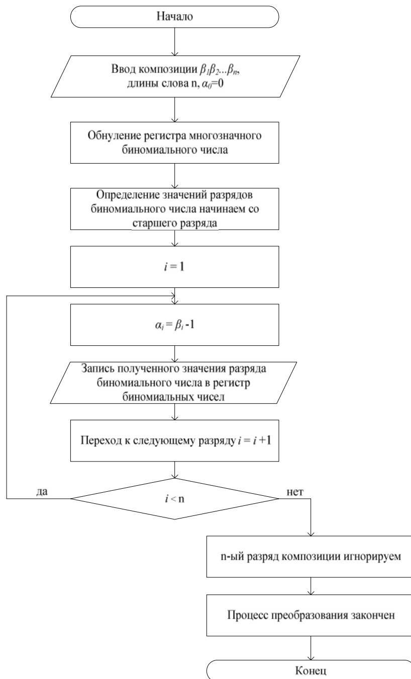
Рисунок 1 – Блок-схема алгоритма получения многозначного биномиального числа