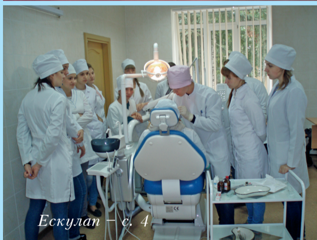
Ескулап – с. 4