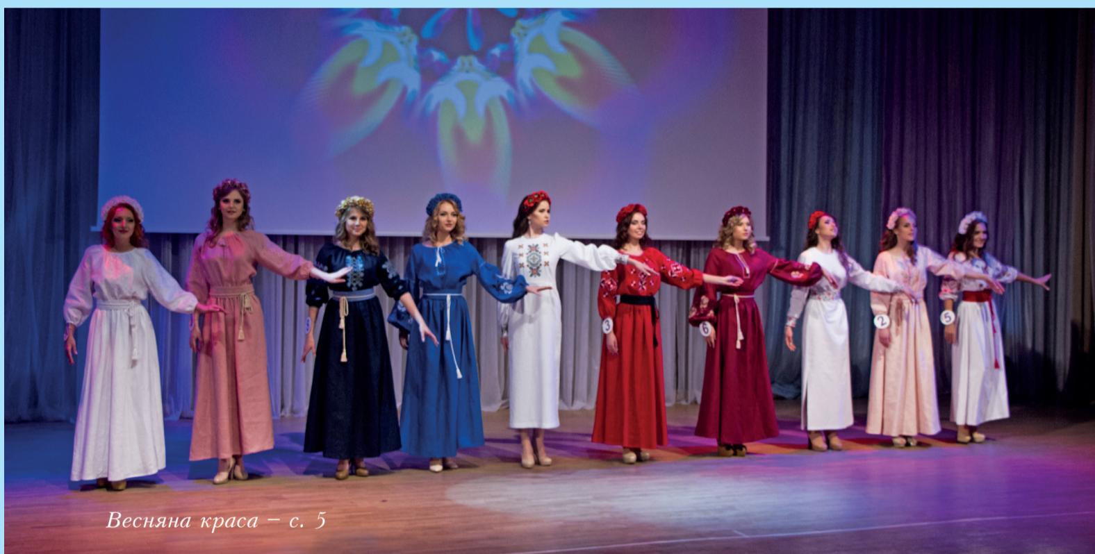
Весняна краса – с. 5

Студентські олімпіади ще тривають, на сьогодні кількість призових місць – 26.