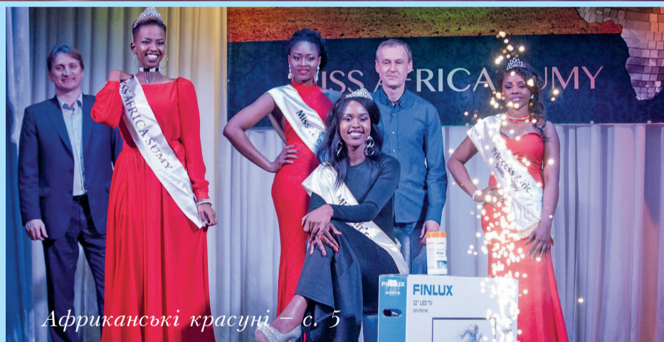
Африканські красуні – с. 5