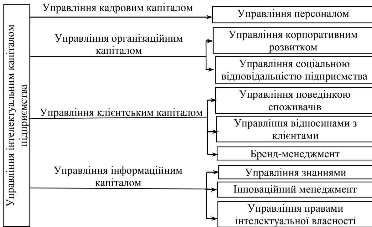
Рис. 2 Взаємозв'язок управління інтелектуальним капіталом з іншими напрямками управління на підприємстві

У другому розділі « Методичні основи забезпечення стратегічного управління інтелектуальним капіталом підприємства » удосконалено організаційно-економічний механізм управління інтелектуальним капіталом підприємства, науково-методичний підхід до оцінки його інтелектуального капіталу та методичні засади вибору стратегії управління інтелектуальним капіталом.