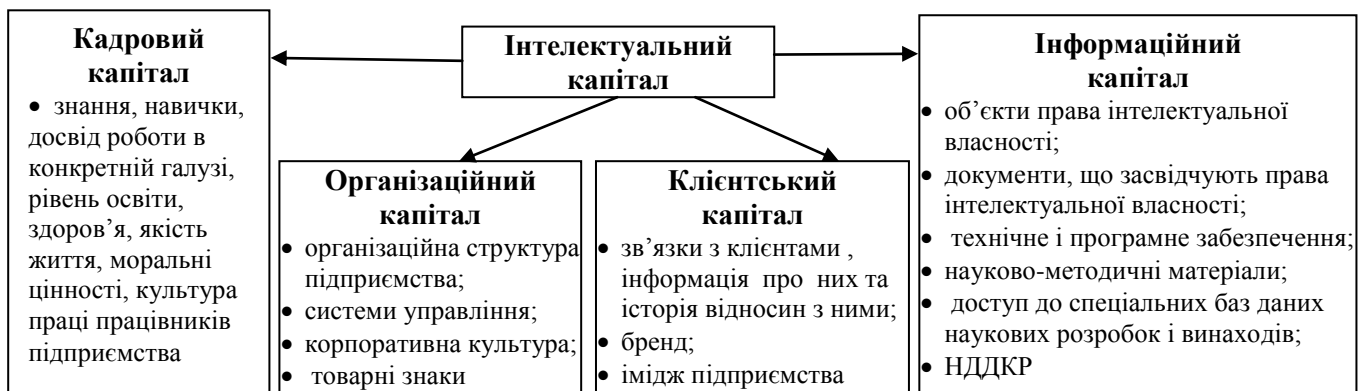
Рис. 1 Структура інтелектуального капіталу

зростання, забезпечення продуктивності праці та конкурентоспроможності. Виробнича функція інтелектуального капіталу підприємства полягає у залученні його активів у виробничих процесах. Відтворювальна функція проявляється у тому, що інтелектуальний капітал задає основний вектор та швидкість розвитку виробництва, оновлення технологій, вдосконалення бізнес-процесів підприємства. Стимулююча функція спрямована на стимулювання поліпшення здібностей людей в процесі їх діяльності. Сутність функції забезпечення продуктивності праці полягає у формуванні базису технічного та технологічного оновлення виробничого процесу, застосуванні нових підходів у системі менеджменту на підприємстві, створенні необхідних умов праці, що дозволяє підвищити її ефективність. Функцію забезпечення конкурентоспроможності можна розглядати як інтегруючий модуль усіх попередніх функцій, оскільки інтелектуальний капітал підприємства є головним чинником формування і забезпечення його конкурентних переваг.