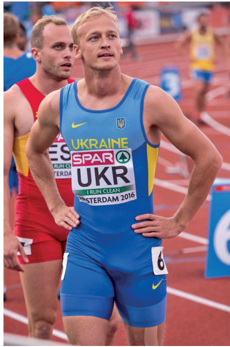
Ігор Бодров (зліва) Оксана Шкурат

На останніх літніх Олімпійських іграх в Ріо-де-Жанейро (Бразилія) честь України захищали магістранти нашого університету Віталій Бутрим (легка атлетика, біг на 400 м), Оксана Шкурат (легка атлетика, біг на 100 м з/б), Ньябали Кеджау (дзюдо, вагова категорія 90 кг) і випускники СумДУ Сергій Смелік (легка атлетика, біг на 200 м), Ігор Бодров (легка атлетика, біг на 200 м), Анна Плотіцина (легка атлетика (біг на 100 м (з/б)).