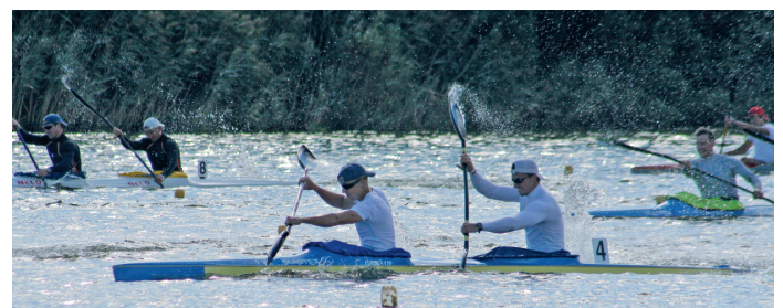
На водно-веслувальній базі