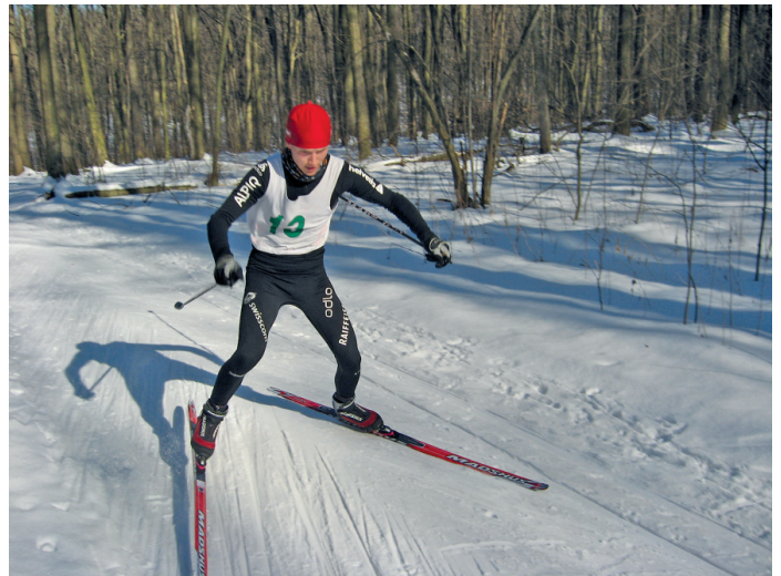
На лижній базі

На сьогодні в СумДУ існує потужна база для розвитку фізичної культури і спорту серед студентів та співробітників університету. Зокрема в базовому ВНЗ функціонують 5 спортивних комплексів (близько 30 споруд). До послуг студентів та співробітників сучасний легкоат-