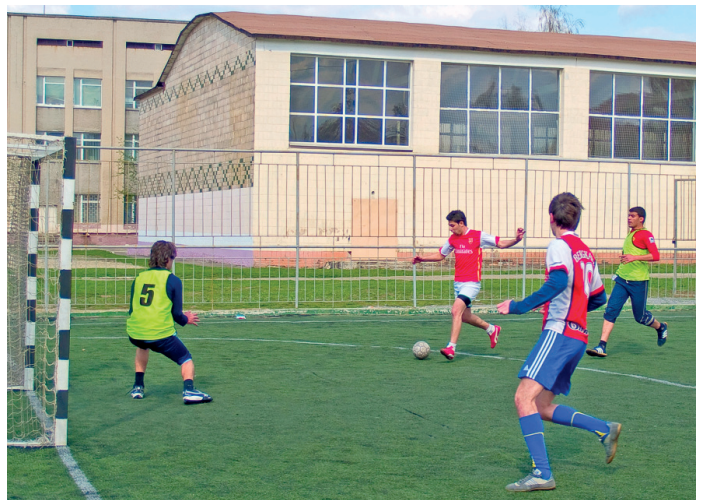
Майданчик зі штучним покриттям