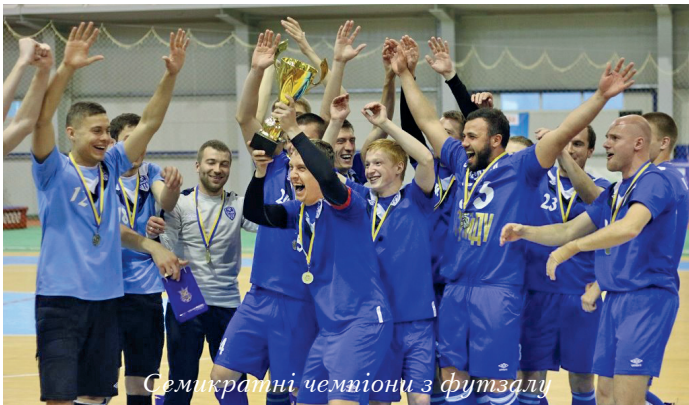
Семикратні чемпіони з футзалу

У новому навчальному році (2016–2017) на нас чекають цікаві спортивні події, у яких братимуть участь і студенти-спортсмени СумДУ. Зокрема XIII літня Універсіада України, XXVIII зимова Універсіада–2017 (Алмати, Казахстан), XXIX літня Універсіада–2017 (Тайбей, Тайвань), а також чемпіонати Європи, світу, міжнародні змагання з різних видів спорту. Вдалих стартів і переможних фінішів!