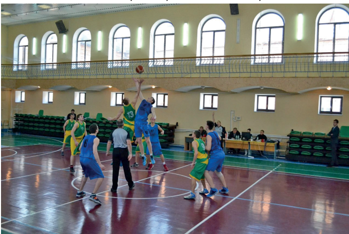
Тренувальна база баскетбольної команди СумДУ