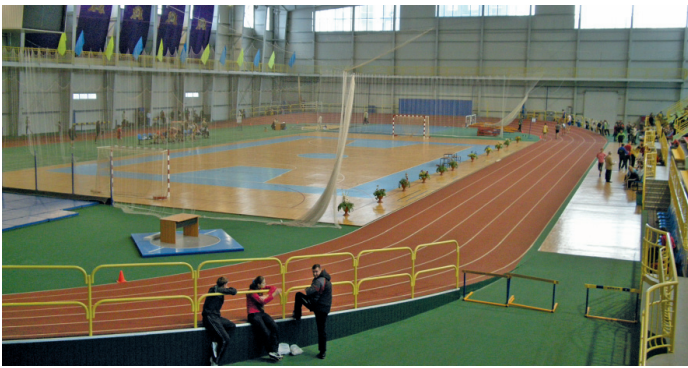
Легкоатлетичний манеж (всередині)