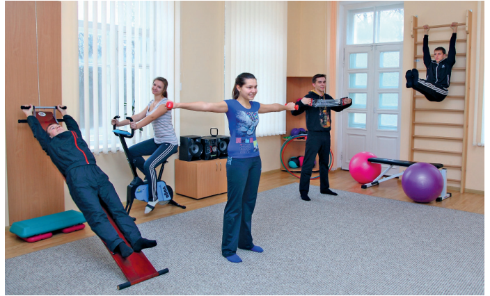
Зал ЛФК санаторію-профілакторію