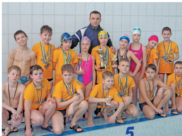
Команди СумДУ зорієнтовані на підготовку спортивного резерву. На фото – команда молодших школярів із плавання (угорі); майбутні олімпійці (унизу)