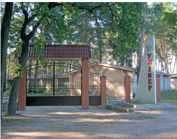
Спортивно-оздоровчий центр «Універ» – унікальне місце для тренування та відпочинку