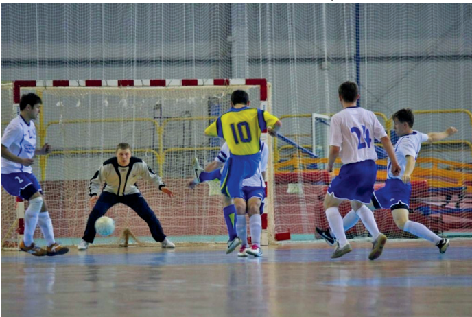
Футзальна команда СумДУ – один із лідерів серед команд України