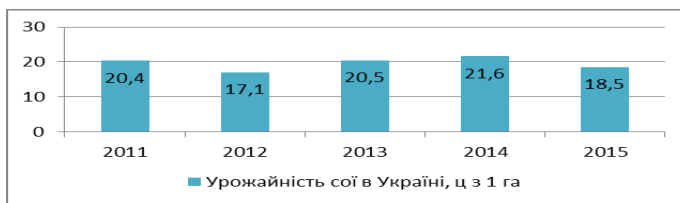
Рис. 2 – Урожайність сої в Україні, ц з 1 га [1]

Коливання урожайності пояснюється природними та технологічними факторами, які здійснюють безпосередній вплив на продуктивність культури. Урожайність сої в США за період 2013-2016 рр. збільшилася з 44 до 48 бушелів з акру. Збільшення виробництва сої в Україні й у світі в цілому активізує торгівлю нею.