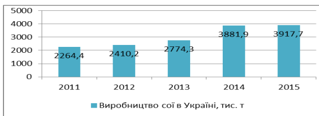
Рис. 1 – Динаміка виробництва сої в Україні, тис. т [1]

Обсяги виробництва цієї культури в світі за останні 50 років виросли майже в 10 разів, що підтверджує ефективність експортно-імпортних операцій з нею на ринку. За даними Держкомстату, динаміка виробництва сої на ринку України має чітку тенденцію до зростання (рис. 1), а її урожайність характеризується нестабільністю (рис. 2).