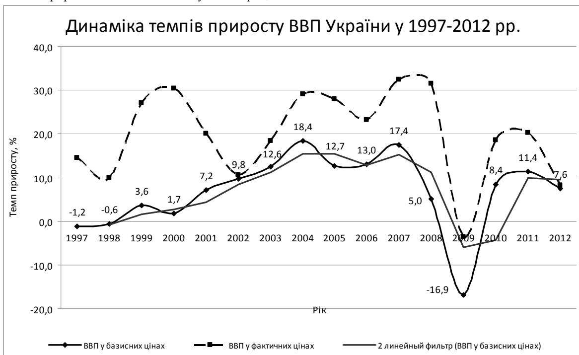
Рисунок 2. Динаміка темпів приросту ВВП України у 1997-2012 рр.

Однак для того щоб дослідити циклічність динаміки ВВП, варто розглянути темпи приросту даного показника (рис. 2).