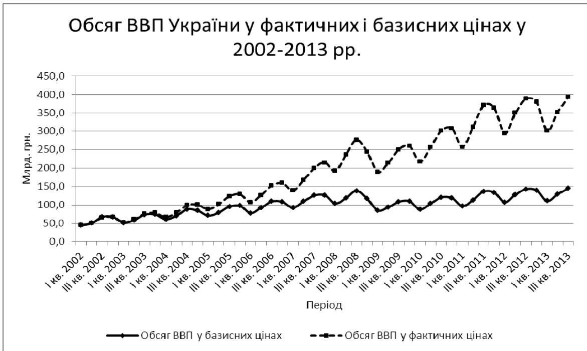
Рисунок 3 – Динаміка обсягу ВВП України у фактичних і базисних цінах у 2002–2013 рр. [побудовано за даними Державної служби статистики України [1, 2]]