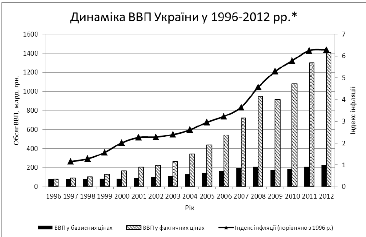
Рисунок 1. Динаміка ВВП України у 1996-2012 рр.

Продовжимо дослідження економічних циклів в Україні до теперішнього часу. Аналізуючи річні дані про обсяги ВВП України з метою дослідження циклічності динаміки даного показника, доцільно розглядати реальний ВВП, тобто ВВП у цінах базисного року (у даному випадку 1996 р.). У такому разі результати дослідження не відобразатимуть змін, спричинених ростом інфляції. Особливо актуальним це є у нашому випадку, оскільки за період, що аналізується (1996-2012 рр.), ціни в Україні зросли більш ніж у 6 разів (рис. 1).