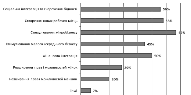
Рис. 2. Місії європейських банків, що надають мікрофінансові послуги

Загалом, більшість мікрофінансових організації мають соціальну місію (рис. 2), наприклад: розширення доступу до фінансових послуг, зниження рівня бідності, розширення прав та можливостей жінок, побудова солідарного суспільства або сприяння економічному розвитку певного регіону [1].