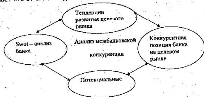
Рис. 1. Составляющие анализа межбанковской конкуренции

I. Введение. Стратегия банка - есть концептуальная основа его деятельности, определяющая приоритетные цели и задачи банка, а также определения путей их достижения. Стратегия коммерческого банка отличается его от его конкурентов в глазах его клиентов и персонала (1).