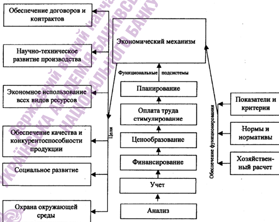
Рис. 1. Схема построения экономического механизма предприятия

Дело в том, что в прежних условиях финансовый аспект в системе управления экономикой предприятия был очень несовершенен. Финансовое планирование и взаимоотношения с бюджетом полностью регулировались сверху. Вышестоящей организацией в централизованном порядке составлялся и утверждался финансовый план в составе его разделов: доходов и поступления средств; расходов и отчисления средств; кредитные взаимоотношения и получение кредитов, за пользование которыми платили мизерные проценты; взаимоотношения с бюджетом, которые также регулировались централизованно. Если предприятию выделялся объем капиталовложений, то вопрос обеспечения финансированием не составлял проблем. Поэтому финансовый механизм практически не работал. Также не работали системы налогообложения, кредитования, ценообразования, предприятиями не регулировались денежные потоки. Функционировало только централизованное финансовое планирование. Поэтому экономический механизм в тех условиях охватывал и функции финансирования.