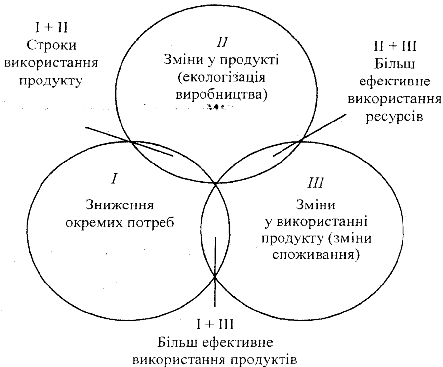
Рис. 2. Інноваційні стратегії впливу на об'єкти продовольчої сфери (розроблено на основі [9, с. 255])

На рисунку 2 представлено інноваційні стратегії впливу на об'єкти продовольчої сфери в рамках екополісного підходу з метою розробки рекомендацій щодо прийняття управлінських рішень для продовольчої безпеки в контексті сталого розвитку.