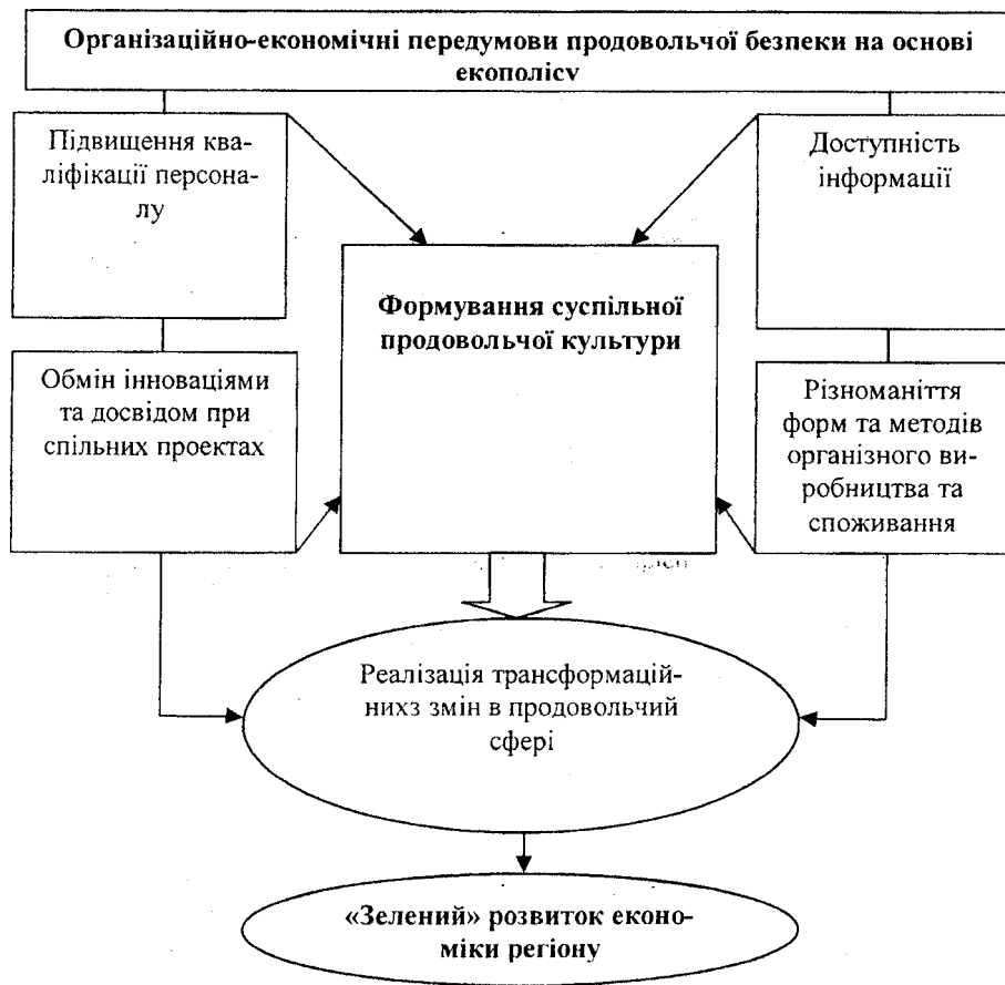
Рис. 3. Організаційно-економічні передумови продовольчої безпеки на основі екополісного підходу

Система організаційно-економічних передумов продовольчої безпеки на основі екополісного підходу представлена на рис. 3.