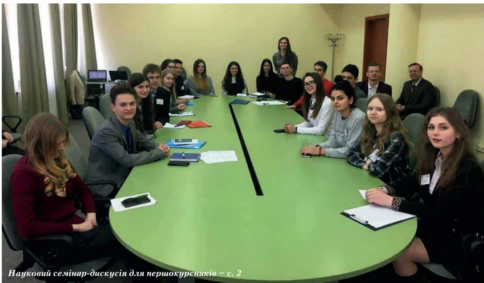
Науковий семінар-дискусія для першокурсників – с. 2

Вибір нашого університету як ексклюзивного партнера аргументував директор Харківського регіонального центру оцінювання якості освіти Олександр Сидоренко: «Звернулися до СумДУ абсолютно свідомо, адже він має найбільш динамічний розвиток упродовж останнього десятиліття, є прикладом успішного досвіду організації вищої освіти в Україні».