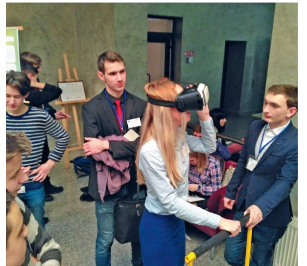
Демонстрація тренажера доповненої реальності

Захід проходив у Конгрес-центрі СумДУ. Студенти молодших курсів мали змогу спробувати свої сили в дев'яти секціях: «Актуальні проблеми та перспективи розвитку сучасної медицини», «Біофізика», «Держава і право», «Математичні науки. Комп'ютерні та інформаційні технології», «Електронне навчання. Нанотехнології. Матері-