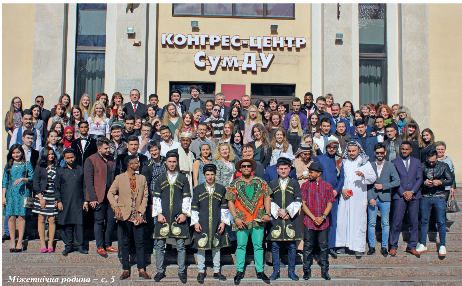
Міжетнічна родина – с. 5