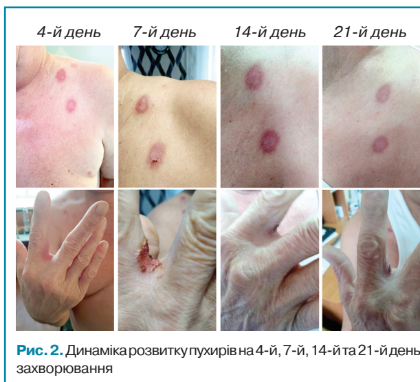
Рис. 2. Динаміка розвитку пухирів на 4-й, 7-й, 14-й та 21-й день захворювання

Отже, бульозний пемфігоїд Левера у цього пацієнта — це рідкісний прояв аутоімунного ураження шкіри внаслідок прийому PD-L блокатора атезоліумабу. Цей стан потребує повної відміни прийому препарату. Хвороба лише на перший погляд вдало піддається імуносупресивній терапії. При досягненні пацієнтом підтримувальної дози преднізолону ( 10 \text{ мг} ) відмічається рецидив бульозного пемфігоїду Левера, який дуже важко контролювати. Тривалий прийом стероїдних гормонів зумовлює ризик розвитку ускладнень, що загрожують життю.