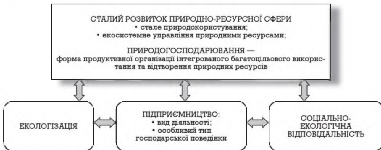
Рис. 1. Визначальні соціально-еколого-економічні орієнтири розвитку підприємництва в природно-ресурсній сфері

Запропоновані напрями розвитку підприємництва на еколого-економічних засадах сформовано, в основному, відповідно до структурно-функціональної схеми лісгосподарського комплексу, а також на основі існуючих основних напрямів екологічного підприємництва. Також важливо підкреслити, що ринкова організація лісгосподарського виробництва, яка стимулює залучення інвестицій до цієї