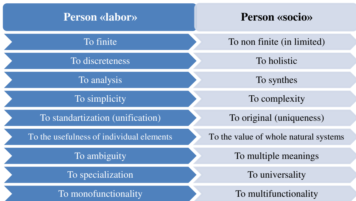
Figure 1. Comparative scheme of behavioral attitudes-aspirations of a person "labor" and a person "socio"

The economic system aims to satisfy the needs of all three conditional components of the essential human triad. However, the structure of these aggregate needs is constantly changing. At the same time, it is possible to note the tendency of a gradual increase in the share of a person's social needs in their overall structure. In particular, in the conditions of modern production, it is increasingly easier (in the sense of lower costs) to feed and provide living conditions for the "bio" person. It is increasingly difficult to satisfy the growing needs of the "socio" person, who acquires more complex properties.