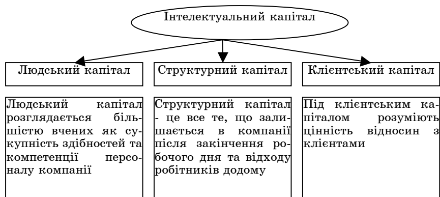
Рисунок 1 – Складові інтелектуального капіталу

При цьому структурний капітал поділяється більшістю вчених на клієнтський та організаційний, у структурі якого можна виділити інноваційний та процесний капітали. Процесний капітал – це інфраструктура компанії, тобто це сукупність інформаційних технологій, робочих процесів тощо.