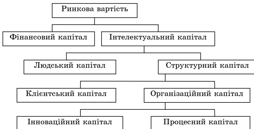
Рисунок 2 - Структура інтелектуального капіталу в моделі «Skandia Value Scheme» Л. Едвінсона

Про інноваційний капітал згадується в найбільш відомій моделі «Skandia Value Scheme» Л. Едвінсона (рис.2), що була розроблена для шведської страхової компанії, яка вперше включила інтелектуальний капітал (а відповідно рис.1 й інноваційний капітал) до свого річного звіту.