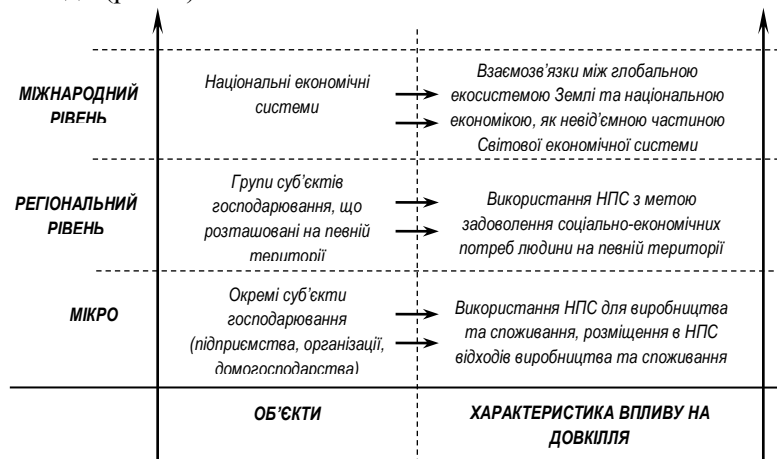
Рисунок 1 – Рівні еколого-економічних взаємозв'язків в системі управління економічним потенціалом регіону

Концепція управління ЕПР з УВЕБ повинна пов'язувати у єдине ціле три основні регіональні підсистеми (інституціональну, соціально-економічну та екологічну) і розкривати основні принципи їх взаємодії (рис. 1).