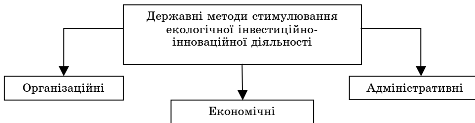
Рисунок 1 – Система методів державного управління (регулювання і стимулювання) екологічно спрямованої інвестиційно-інноваційної діяльності

Адміністративні методи обмежують діяльність виробників екологічно небезпечних товарів, що змушує їх відмовлятися від виробництва екологічно небезпечних товарів та здійснення екодеструктивної діяльності з великим тиском на навколишнє середовище на користь екологічно спрямованих чи екологічно прийнятних.