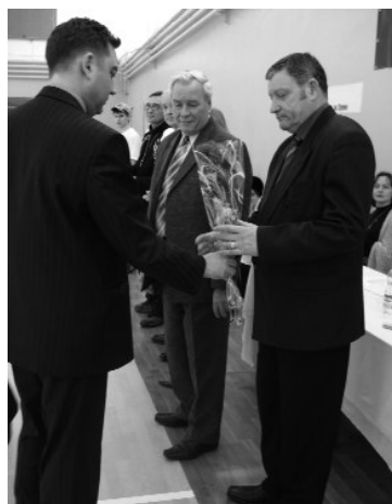
фрагменти конкурсу.

«Все в твоїх руках і навіть... студентство СумДУ» Хочеш стати студентським ректором? Довести разом з командою, що будь-які проблеми студентського життя можна вирішити? Візьми участь у виборах 21 березня! Для оформлення заявки звертайся у студентський ректорат Г610 (до 14 березня)!