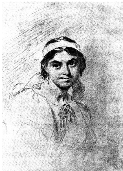
Т. Г. Шевченко. Портрет Ликери Полусмакової. 1860 р.

Від нервового збудження схопило серце і майже весь вересень, аж до 6 жовтня, прохворів. 6 жовтня до нього завітав громадівець Федір Черненко. Він побачив на мольберті портрет Ликери, який Тарас перед тим оглядав, бо все ще кохав Ликеру й готовий