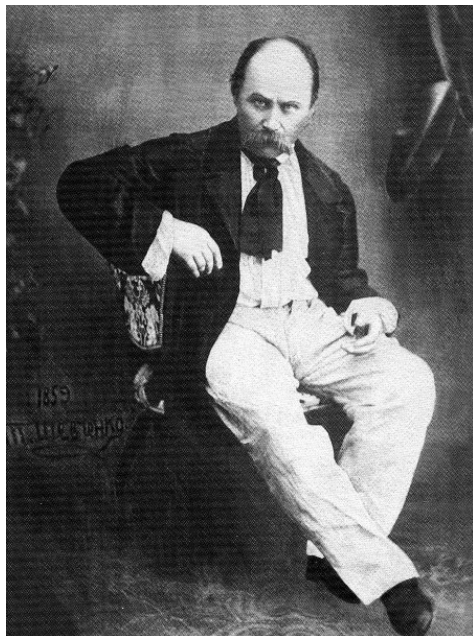
Тарас Шевченко. Фото