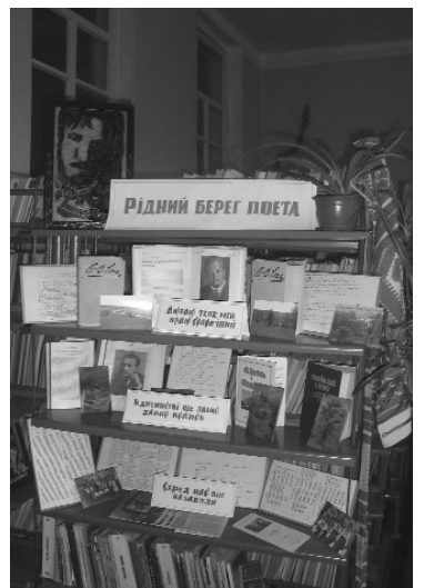
Куточок О. Олесья у Верхосулській сільській бібліотеці