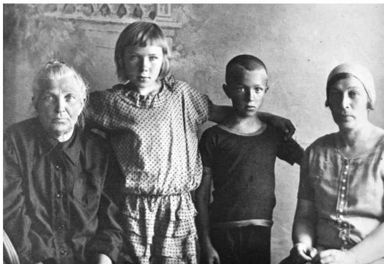
Мати, сестра, племінники. Суми, початок 1920-х років