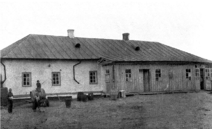
Білопілья, будинок по вул. Покровській, у якому народився О.Олесь. Фото 1912 р.

Свято завершилося. Особливо запали в душу слова учасника кон-