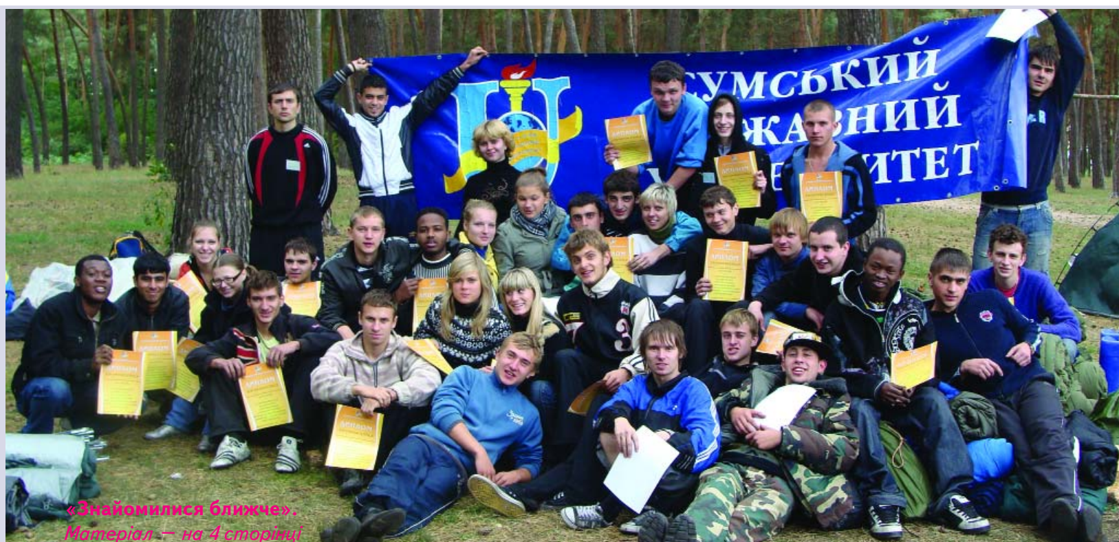
«Знайомилися ближче». Матеріал – на 4 сторінці