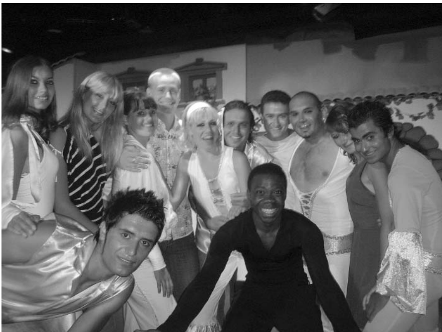
Щовечора – шоу: навчатися треба чесело

– Треба, щоб гості знали тебе і щоб ти постійно був на виду. Там нас навчили і співати, і танцювати, і ще багато чого. Кожен вечір – шоу. Цікавилися, чи ми не з театрального? З гордістю відповідали – із Сумського державного! Там у нас з'явилося чимало нових друзів, з якими продовжуємо спілкуватися і тепер, роз'їхав-