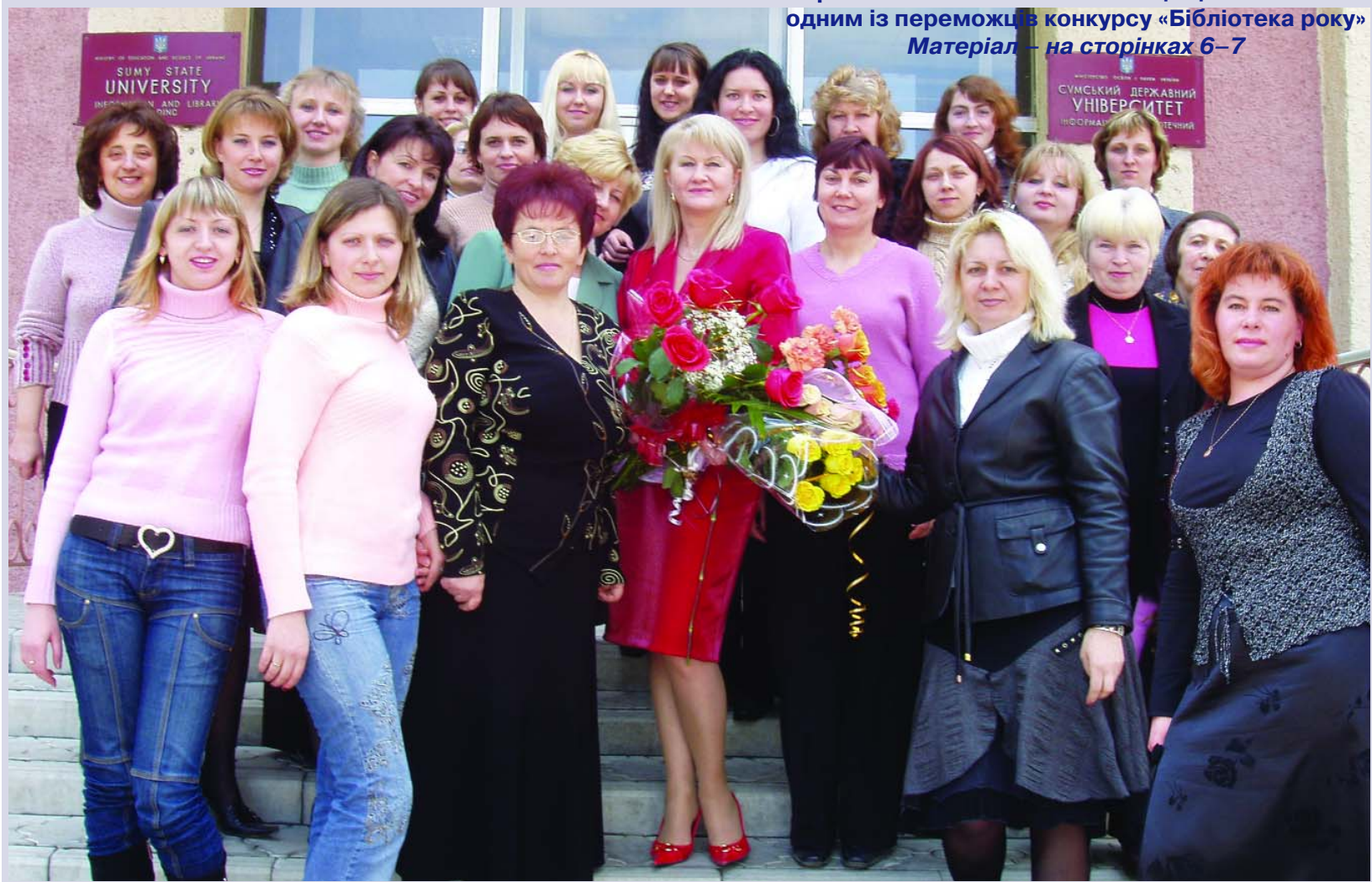
Бібліотечно-інформаційний центр СумДУ Українською бібліотечною асоціацією визнаний одним із переможців конкурсу «Бібліотека року» Матеріал – на сторінках 6-7