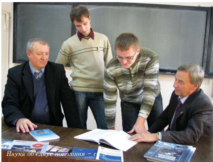
Наука об'єднує покоління – ст. 9