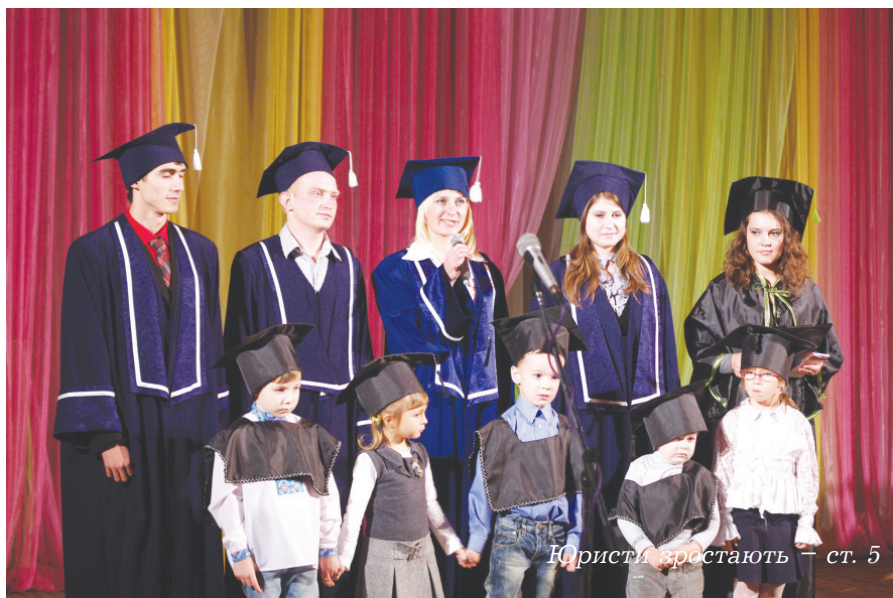
Юристи зростають – ст. 5