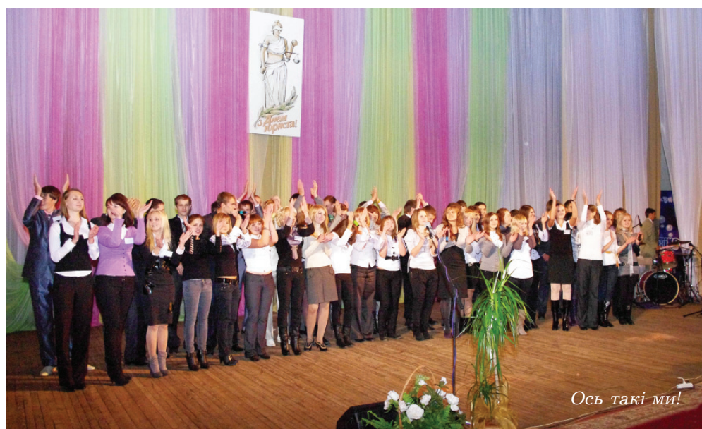
Ось такі ми!