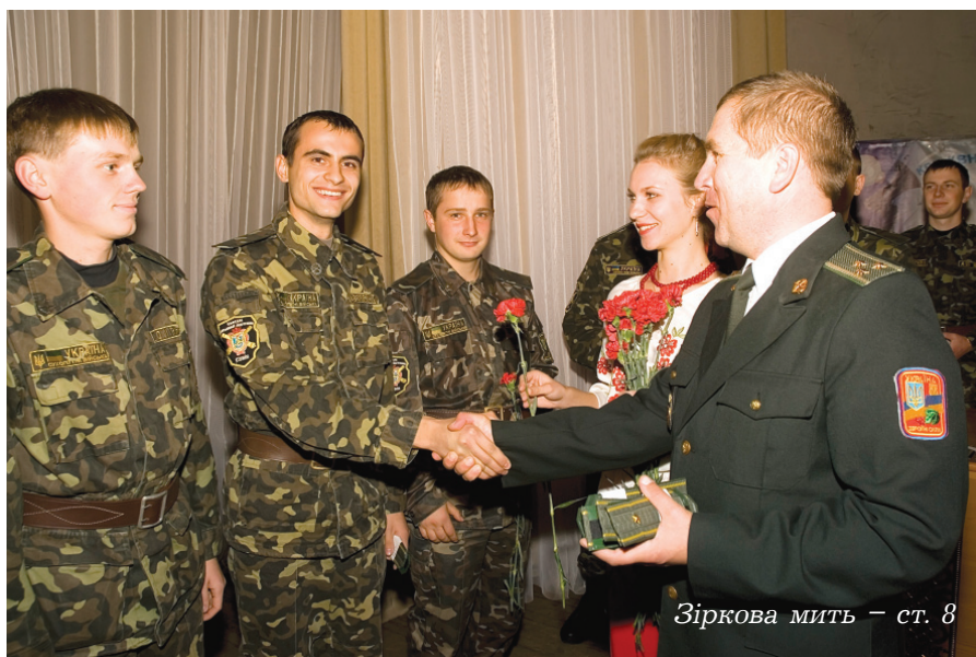
Зіркова мить – ст. 8

Інші вищі навчальні заклади нашої області розмістилися значно нижче: УАБС НБУ – 71-88-ме місце, СумДПУ ім. А.С. Макаренка та СНАУ – 89-103-те місце. Глухівський національний університет ім. О. Довженка – у середині другої сотні загальної списку.