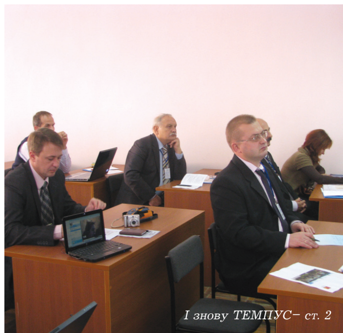
І знову ТЕМПУС – ст. 2