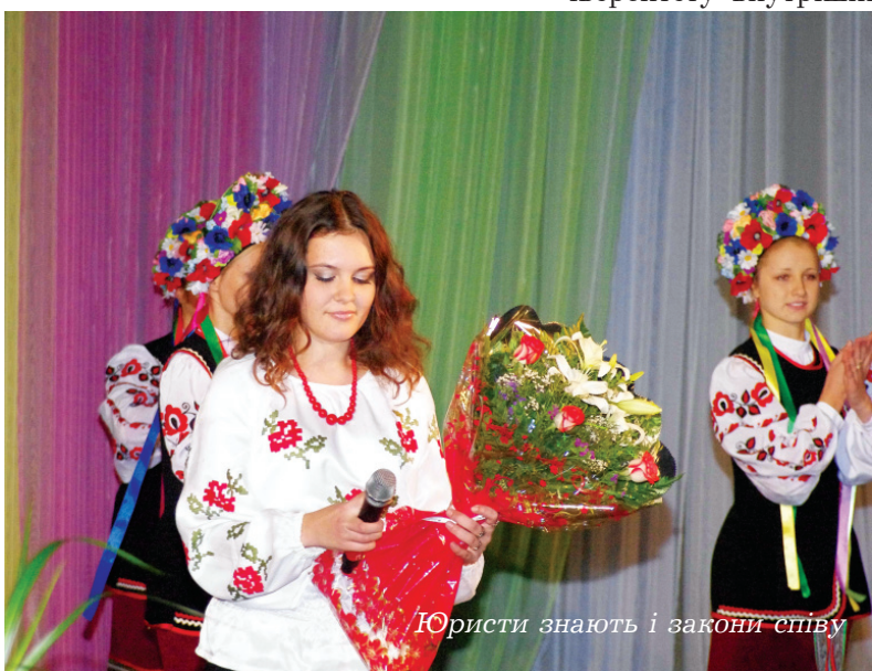
Юристи знають і закони співу