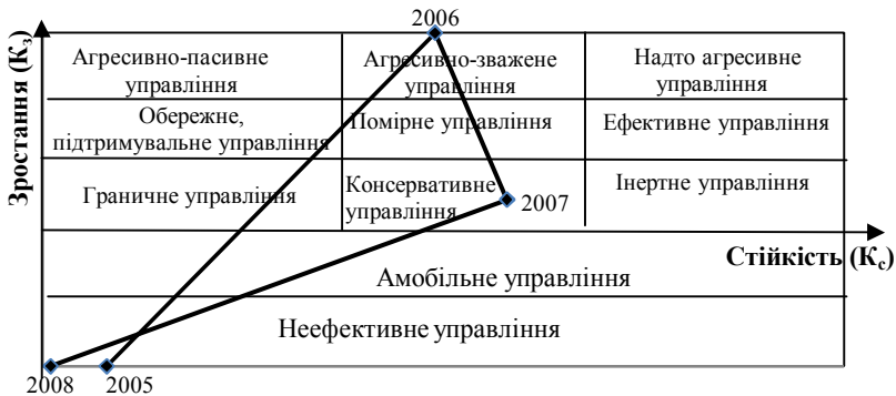
Рис. 2. Матриця вектора економічного розвитку ВАТ «СМНВО ім. М.В. Фрунзе»

У процесі апробації запропонованого підходу на ВАТ «СМНВО ім. М.В. Фрунзе» було встановлено, що позитивна динаміка зміни об'ємних показників за 2005-2007 рр. не забезпечила потенціалу ресурсних можливостей підприємства для подолання негативних тенденцій господарювання й достатнього запасу стійкості для ефективної діяльності у наступні періоди (рис. 2). Основними факторами, що стримують економічне зростання досліджуваного підприємства, є: зменшення чистого прибутку підприємства, значне збільшення поточних зобов'язань, нерациональна структура капіталу підприємства.