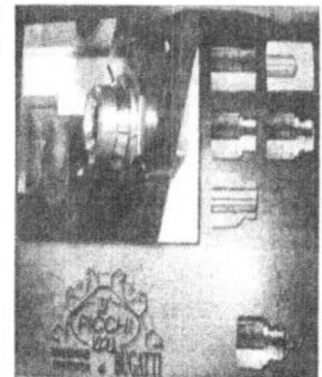
Рис. 3 – Фрагменти відеофільму за темою «Деталі обертання»