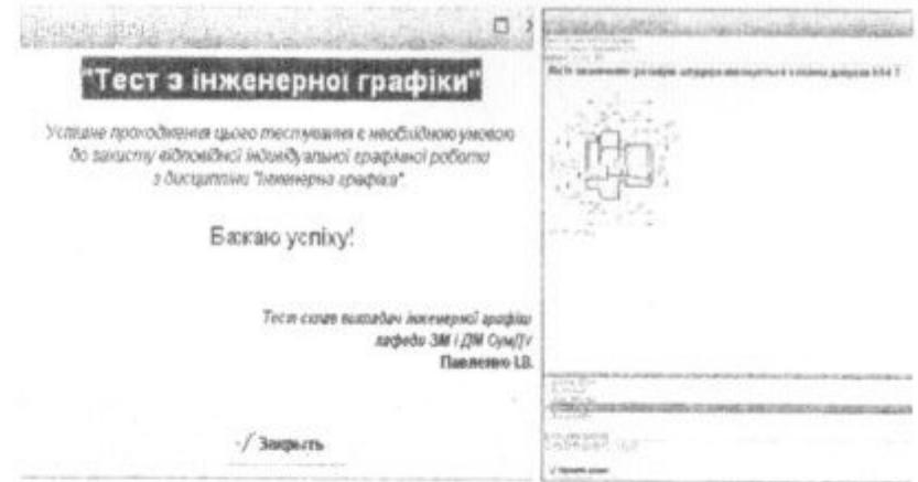
Рис. 1 – Автоматичне тестування із застосуванням комп'ютера

До сказаного вище додамо, що всі форми проведення аудиторних занять переведено до мультимедійної аудиторії [11]. Із використанням можливостей такої аудиторії викладач демонструє послідовність побудови креслень (рис. 2). А використання озвучених відеофільмів (рис. 3) для демонстрації у робочих умовах деталей, які студент має накреслити, створює передумови до всебічного вивчення представленого на занятті матеріалу, сприяє проведенню міждисциплінарних зв'язків з базовими технічними дисциплінами.