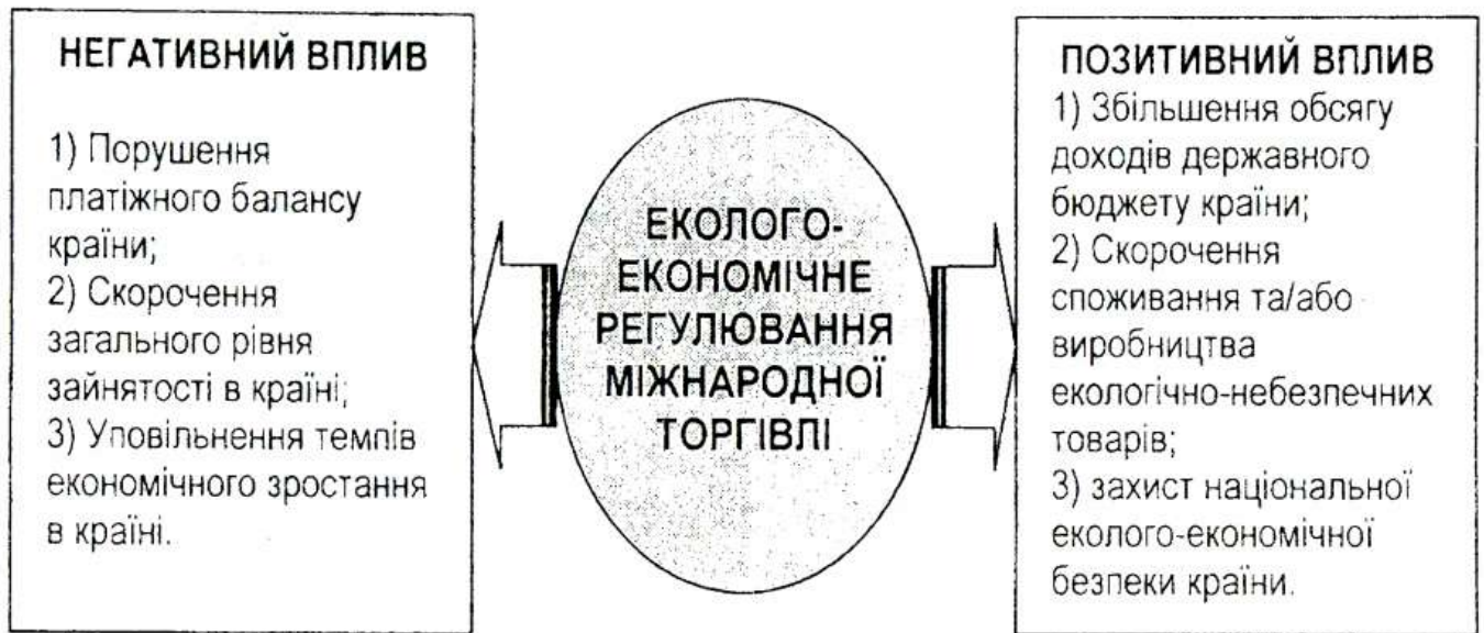
Рис. 2 Вплив національного еколого-економічного регулювання міжнародної торгівлі на економіку країни

Вплив національного еколого-економічного регулювання міжнародної торгівлі на економіку країни може мати як позитивний так і негативний характер (рис. 2).