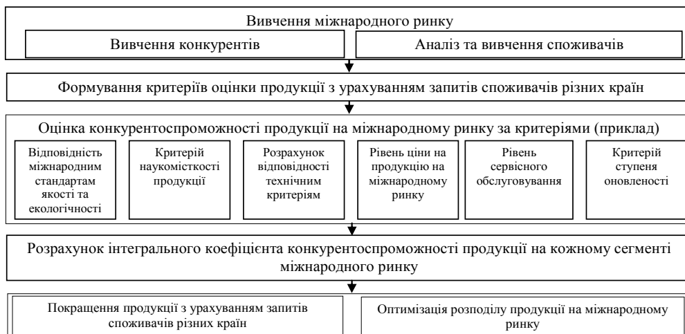
Рисунок 3 – Послідовність оцінки конкурентоспроможності продукції на міжнародному ринку

Її застосування дозволяє корегувати характеристики продукції залежно від вимог ринку різних країн, підвищуючи тим самим конкурентоспроможність продукції, а також оптимізувати розподіл готової продукції залежно від поточного стану її конкурентоспроможності на сегментах міжнародного ринку.