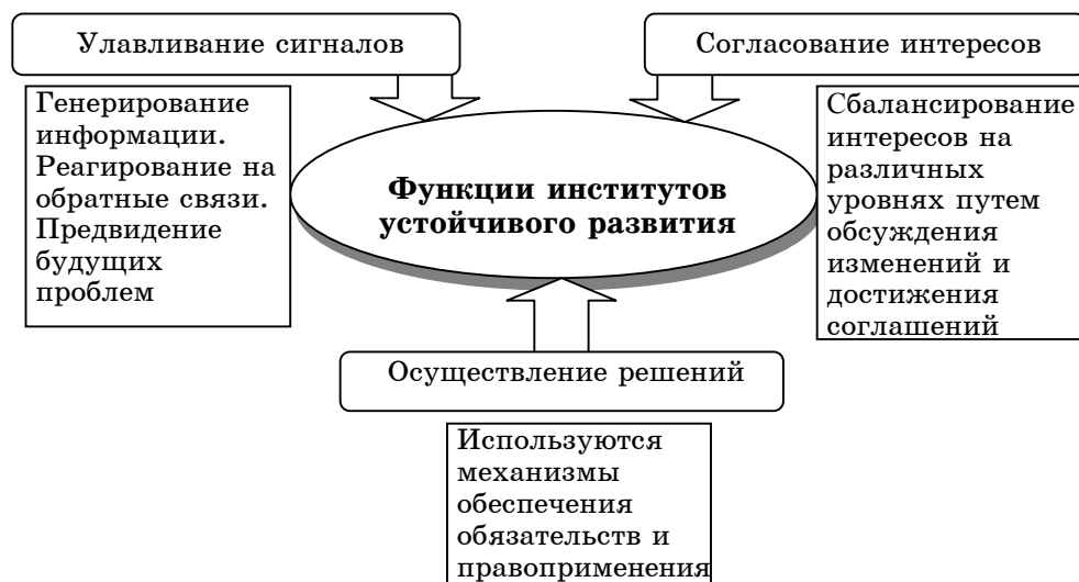
Рисунок 2 - Функции институтов устойчивого развития

Институциональная среда как совокупность основополагающих социальных, политических, юридических и экономических правил, определяющих рамки поведения, призвана выполнять многообразные функции. Но среди них необходимо выделить три основные функции, обеспечивающие надежную и целенаправленную координацию действий (см. рис. 2).