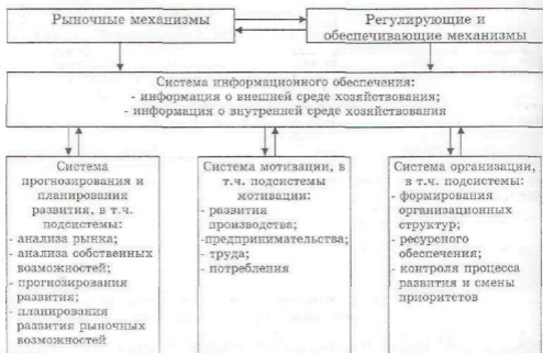
Рисунок 3 - Схема взаимодействия систем ЭМУИР на макро- и микроуровнях управления

Микроуровень ЭМУИР состоит из следующих структурно-функциональных систем (рис. 3): прогнозирования и планирования развития; мотивации; организации; информационной. Рассмотрим структуры этих систем и реализуемые ими функции.