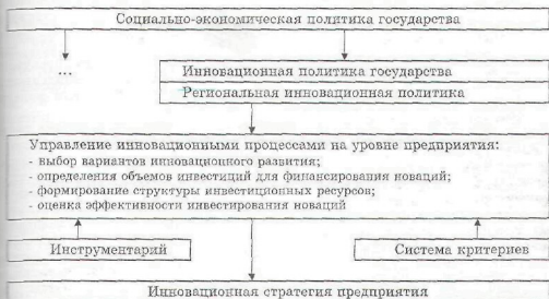
Рисунок 4 - Схема взаимосвязей уровней управления процессами инновационного развития

Достижение целей инновационного развития рыночных возможностей предприятий происходит в рамках государственной и региональной инновационной политики, которые, в свою очередь, реализуются в рамках социально-экономической политики, как одно из ее направлений (рис. 4).