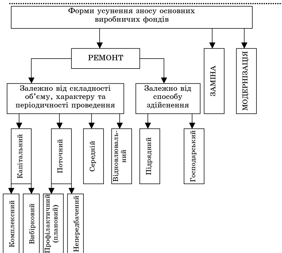
Рисунок 2 – Форми усунення зносу основних виробничих фондів

використання [7]. Такі фактори можна поділити на екстенсивні, інтенсивні та екстенсивно-інтенсивні (рис.2).