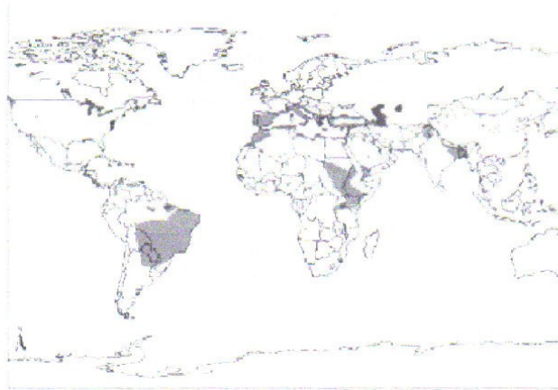
Мал. 1. Географічний розподіл ВЛ у Старому і Новому Світі.

У даний час Л реєструється на чотирьох континентах і вважається ендемічним захворюванням у 88 країнах, 72 з яких є країнами, що розвиваються (мал. 1, 2): 90 % усіх випадків ВЛ припадає на Бангладеш, Бразилію, Індію, Непал і Судан. 90 % Л шкірно-слизового реєструється в Болівії, Бразилії та Перу. 90 % випадків ШЛ припадає на Афганістан, Бразилію, Іран, Перу, Саудівську Аравію і Сирію [6].