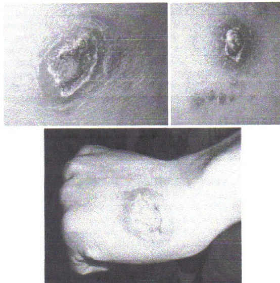
Мал. 3. Лейшманіоми у хворих з ШЛ.

ли ШЛ Старого світу, зоонозний підтип, первинну лейшманіому. При ушпиталенні в усіх хворих відмічалася первинна лейшманіома у стадії виразки (мал. 3), вузлика або рубцювання, а у пацієнтів, що повернулися з Ірану, діагностований ШЛ Старого світу, антропонозний підтип, викликаний L. tropica . Захворювання виникло під час перебування у відрядженні, де була розпочата етіотропна терапія. Перебіг хвороби був середньотяжким. У 9 хворих розвинулася первинна лейшманіома з типовою еволюцією від стадії вузлика до виразки, в одного хворого – дифузно-інфільтративна лейшманіома. Локалізація процесу: у 3 осіб – кисті однієї або двох рук, у 4 – нижні кінцівки, у 2 – передпліччя, в 1 – губи, передпліччя обох рук, стегно. Діаметр виразок у межах від 1,5 до 5 см, у кількості від 1 до 7 елементів. У половини хворих відмічався регіонарний лімфаденіт. Середнє перебування в стаціонарі склало 31 ліжко-день. Клінічні аналізи крові, сечі без суттєвих змін, тільки у 3 хворих виявлена помірна анемія. Лікування хворих проведено делягілом по 100 мг на добу по 2-3 курси. Для місцевого лікування застосована леваміколева мазь і мазь «Лейшкуган». Всі хворі виписані із стаціонару в стадії рубцювання виразки.