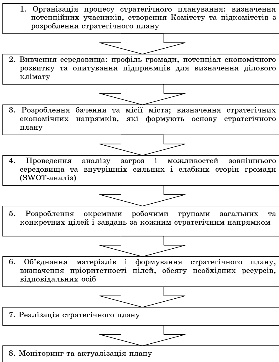
Рисунок 1 – Методологія стратегічного планування економічного розвитку міста, розроблена Bergan Group

разом із впровадженням у систему підвищення кваліфікації службовців таких напрямків, як: стратегічне планування, основи проектного менеджменту тощо [7].