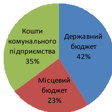
Рисунок – Структура витрат на реалізацію Програми забезпечення населення м. Суми якісною питною водою в достатній кількості на 2006-2020 роки за джерелами фінансування коштів.

Необхідно відмітити, що у загальних видатках на реалізацію запланованих заходів лише 23,5 % складають кошти місцевого бюджету - 40565 тис.грн (рис.). До того ж понад 40% ресурсів повинні бути асигновані на першому етапі впровадження Програми, при чому за перші три роки (2006-2008) обсяг коштів повинен був скласти 10260 тис грн., тобто 25 % загального обсягу запланованих витрат на проведення заходів щодо забезпечення мешканців міста Суми якісною питною водою в достатній кількості. Нажаль, аналіз кошторисів видатків використання фонду охорони навколишнього природного середовища міста Суми за зазначений період показав відсутність серед запланованих напрямків витрачання коштів програм та заходів, які мають на меті виконання зазначеної програми.