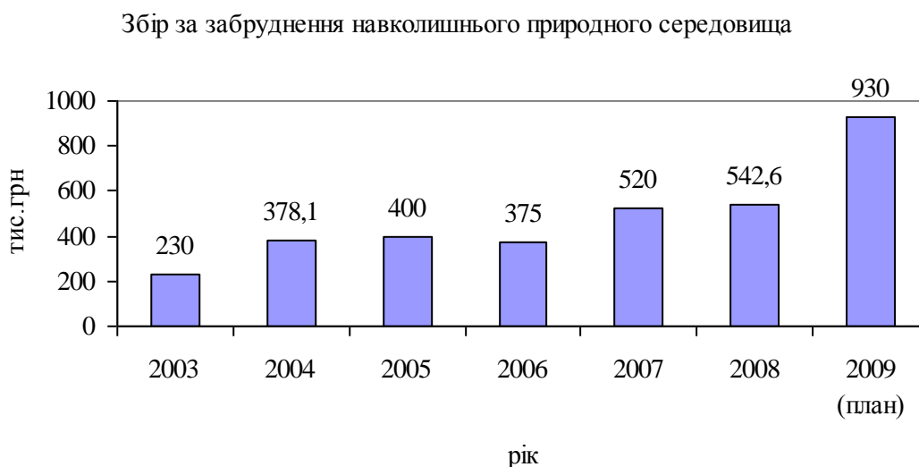
Рисунок 1 – Динаміка надходжень збору за забруднення навколишнього природного середовища до ФОНПС міста Суми

З іншого боку, з позиції принципів екологічно сталого збалансованого розвитку важливим є не тільки абсолютний чи відносний розмір коштів, який збирає територіальна громада для фінансування природоохоронних заходів, але й наявність, кількість та якість екологічних послуг, які мають надаватися за їх рахунок.