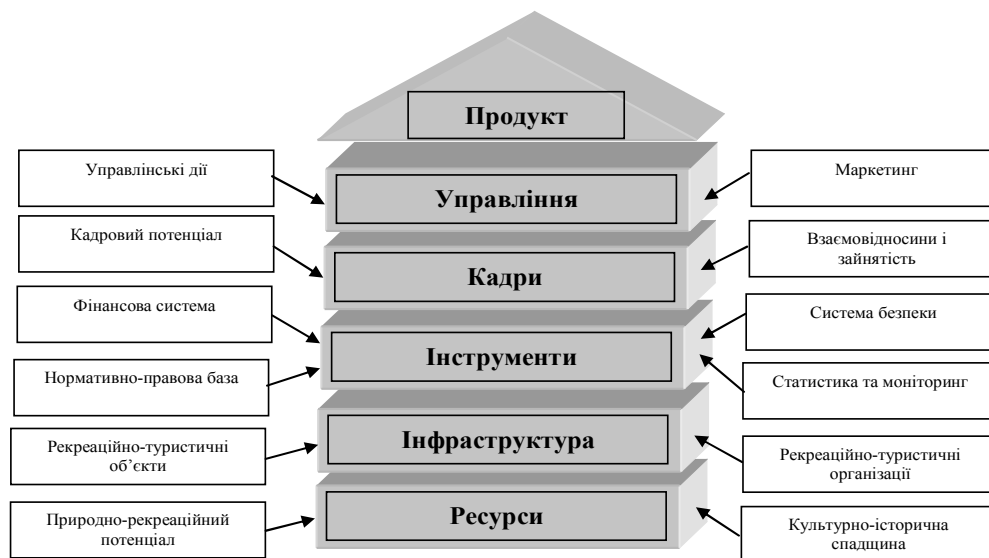
Рисунок 1 – Система формування конкурентоспроможного регіонального рекреаційно-туристичного продукту [6]

Таким чином, виходячи з визначеної вище мети функціонування системи «рекреаційно-туристичний регіон», підсистеми є необхідними умовами її досягнення. Після визначення й постановки цілей при розробленні програми розвитку рекреації та туризму в регіоні необхідно визначити шляхи та інструменти впровадження. При цьому в зазначеній програмі доцільно виділяти такі основні формуювальні блоки: сучасний стан рекреації та туризму в регіоні; завдання розвитку рекреації та туризму в регіоні; напрями формування і реалізації конкурентоспроможного регіонального рекреаційно-туристичного продукту; механізми формування і реалізації конкурентоспроможного регіонального рекреаційно-туристичного продукту [7].