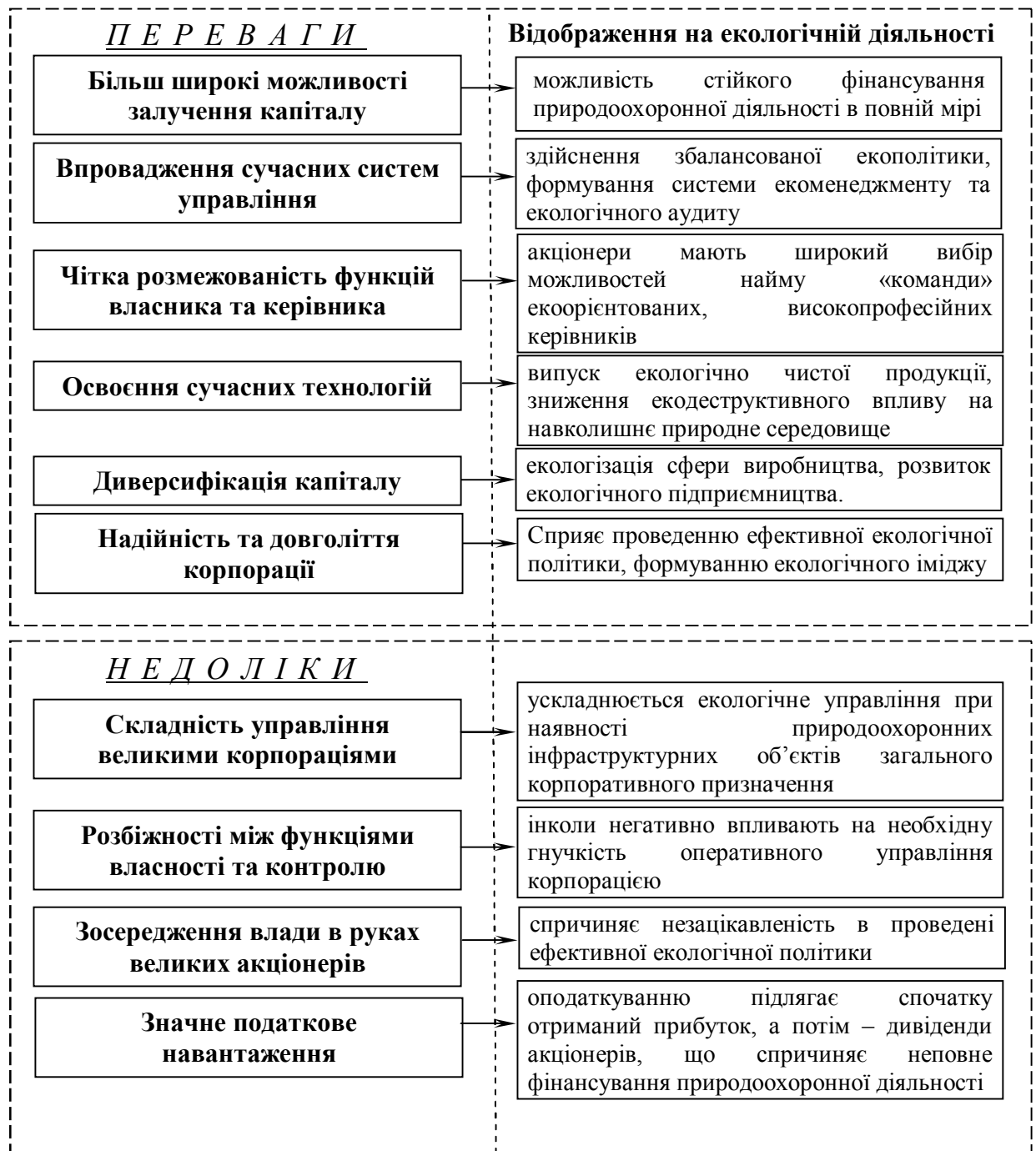
Рис. 1 Систематизація переваг та недоліків функціонування корпорацій з точки зору раціоналізації їх екологічної діяльності

складностей при їх функціонуванні, частина яких, впливає на природоохоронну діяльність та екологічну безпеку господарювання (рис.1) [1,4,13].