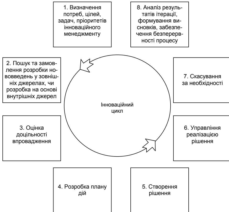
Рис. 1. Етапи інноваційного процесу

На думку автора, особливу увагу в управлінні інноваціями при розробці ПЗ слід приділити управлінню впливом сторонніх компонентів на процес розробки ПЗ, значення якого для сучасних проектів є надзвичайно важливим з урахуванням співвідношення між загальним розміром коду проектів та розміром коду, який мають сторонні бібліотеки компонентів. Це підтвердив здійснений автором порівняльний аналіз кількості рядків основного коду по відношенню до загальної кількості рядків декількох довільно відібраних автором сучасних програмних проектів, які належать до найбільш типової категорії проектів дрібного і середнього розміру, орієнтованих на створення продукту, призначеного для кінцевих користувачів. Згідно з результатами аналізу був зроблений висновок, що для переважної більшості дрібних та середніх проектів частка кількості рядків основного коду в загальній кількості рядків проекту з урахуванням сторонніх бібліотек становить від 1 до 10 %, а це означає, що частка кількості рядків допоміжних бібліотек становить відповідно від 99 до 90 % у загальній кількості рядків проекту. Враховуючи подібне співвідношення, можна стверджувати, що задача управління впливом сторонніх компонентів на процес розробки ПЗ має розглядатися як одна з пріоритетних серед інших задач управління інноваціями.