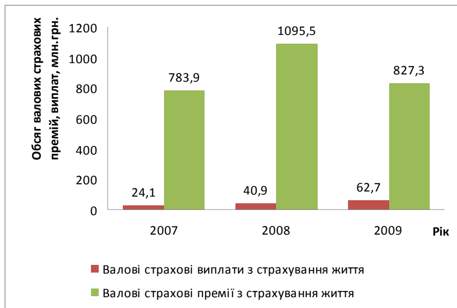
Рис. 3. Динаміка страхових премій та страхових виплат із страхування життя за 2007 – 2009 рр. млн грн

- на 5,2% зросли загальні активи, з них активи, визначені законодавством для представлення коштів страхових резервів – на 10,4%; - загальна кількість страхових компаній становила 451, у тому числі СК «life» – 70 компаній, СК «non-life» – 381 компанія [2].