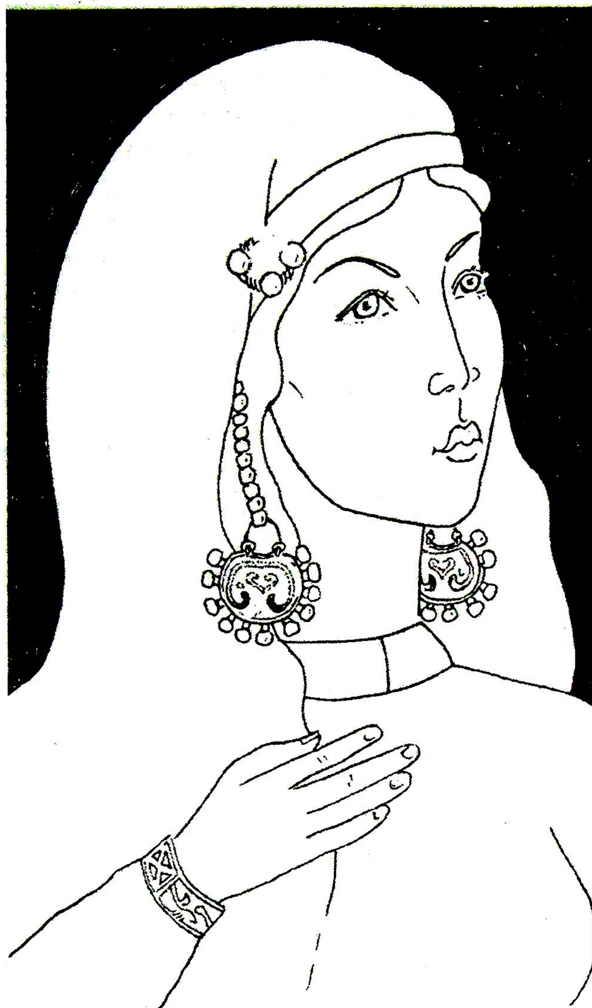
Рис. 2. Жіночий парадний убір зі «скарбу» 2003 р. Реконструкція автора.

За характером оправи та декором колт належить до третього підтипу другого типу, виділеного Т.І.Макаровою. Дослідниця відносить появу таких прикрас до XIII ст. [9, с.49, 58]. Серед іншого, вони відомі в складі скарбів початку XIII ст. з Чернігова [5, с.105]. Найближчим за декором є колт зі скарбу 1970 р. з Божська [17, с.65, рис.41].