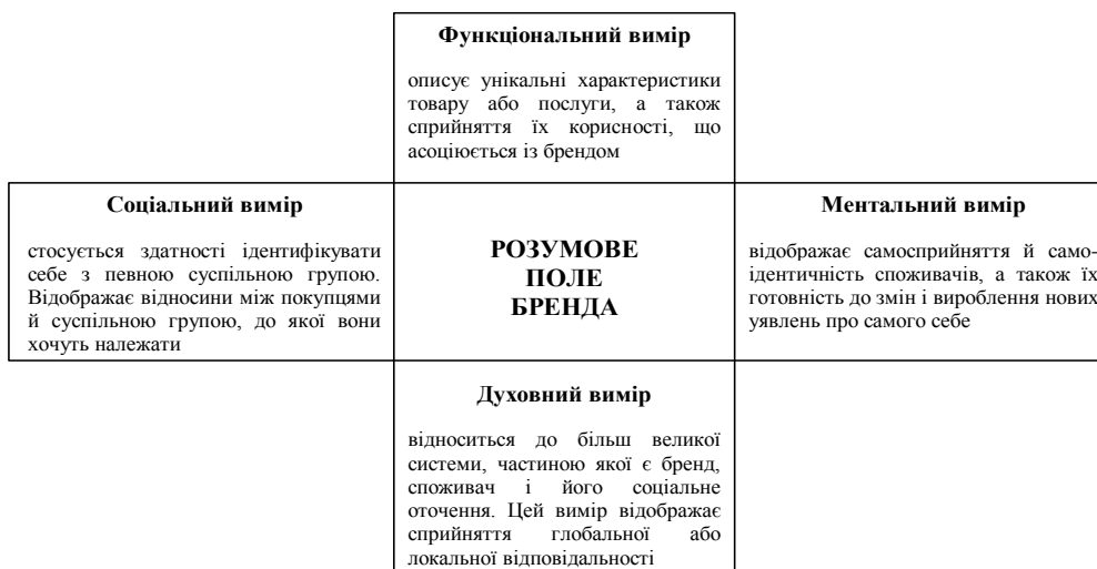
Рисунок 2 – Розумове поле бренда [4]

На його думку, бренд можна подати у вигляді розумового поля бренда , що існує в чотирьох вимірах (рис. 2).