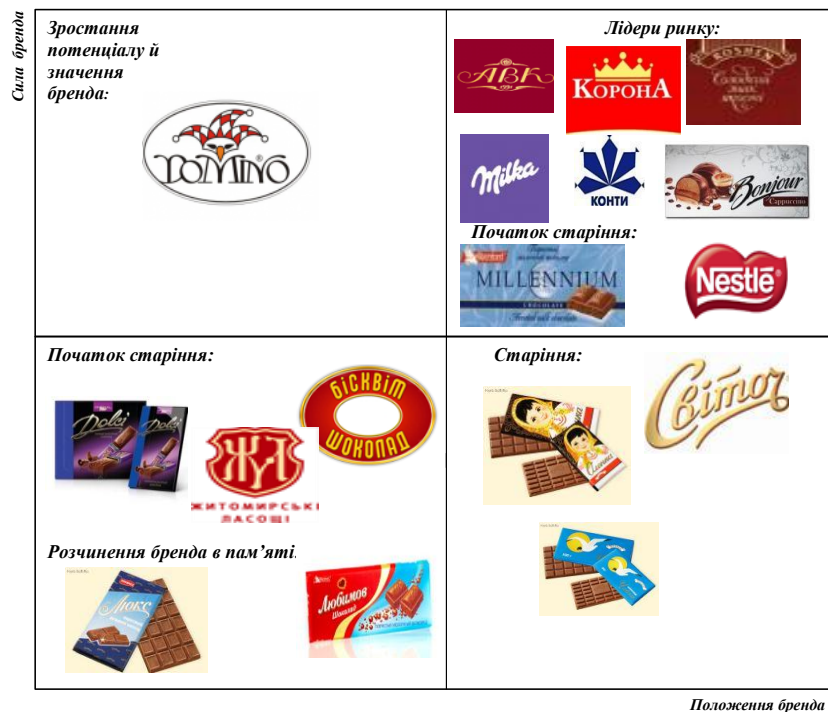
Рисунок 3 – Карта-схема розвитку брендів ринку шоколадно-кондитерської продукції України, (за методикою компанії Young & Rubicam)

Слідом за відмінністю знижується актуальність, що позначається на обсягах продажів. На цій стадії знаходяться такі бренди шоколадних виробів, як ТМ «Світоч» та шоколадні плитки ТМ «Оленка», ТМ «Чайка» від «ROSHEN». У цьому разі можна порекомендувати вдаватися до засобів та технологій ребрендингу або зміни позиціонування [10].