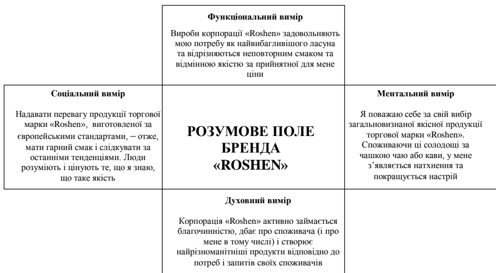
Рисунок 4 – Розумове поле бренду «ROSHEN» за методикою «4D-брендингу»

Використовуючи методику «4D-брендингу», за результатами досліджень експертами компанії-товаровиробника думок споживачів на предмет з'ясування характеру сприйняття ними бренду в розрізі кожного з вимірів шляхом анкетування було побудовано розумове поле бренду «ROSHEN», яке відображає найбільш загальне уявлення споживачів (рис. 4).