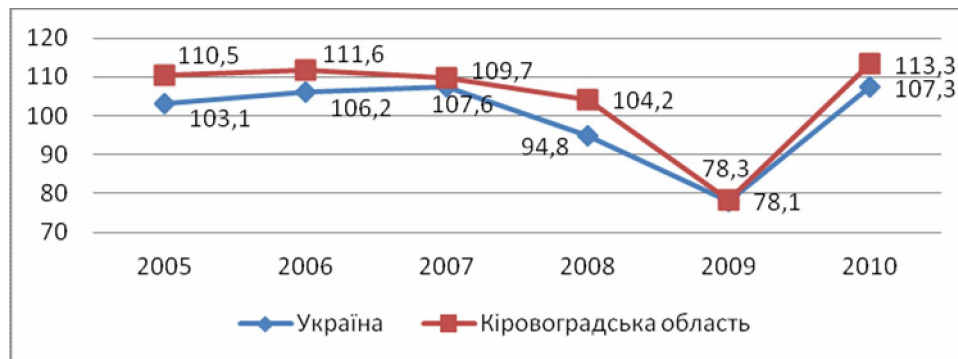
Рис.2. Індекси промислової продукції в Україна та в Кіровоградській області за 2005-2010 роки (складено на основі [3])

Доцільно також порівняти індекси промислової продукції за останні роки в Україні та в Кіровоградській області. Графічно це зображено на рисунку 2. Із графіка видно, що обсяг промислової продукції у 2010 році стрімко зріс на 13,3% по Кіровоградській області і на 7,3% по Україні.