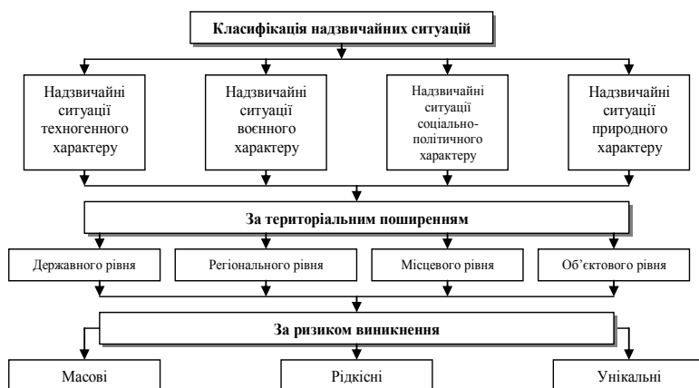
Рисунок 1 – Класифікація надзвичайних ситуацій

У результаті дослідження питань, що стосуються економіки катастроф, виявлено певну залежність між категоріями, які становлять понятійний апарат цієї галузі знань. Будь-яка надзвичайна ситуація відбувається внаслідок катастрофи або аварії. Нами узагальнено та систематизовано класифікацію надзвичайних ситуацій (рис.2).