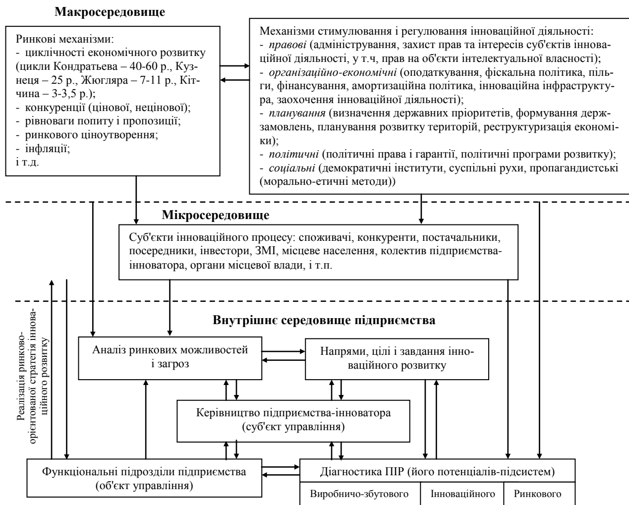
Рис. 1. Схема управління інноваційним розвитком

наприклад, прав на об'єкти інтелектуальної власності; система державних стандартів і методів прямого адміністрування (ліцензування, патентування, квотування тощо). Так, система жорстких стандартів на якість продуктів харчування дала поштовх розвитку фірм, що спеціалізуються на їхній сертифікації.