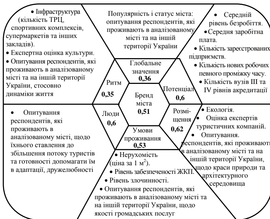
Рисунок 2 – Основні складові критеріїв оцінки бренду міста та їхні джерела

Автором адаптована ця методика до особливостей міст України та виділені складові критеріїв загального індексу (рис. 2). На цій схемі поданий інтегральний індекс бренду м. Сум, отриманий як середнє арифметичне від його показників.