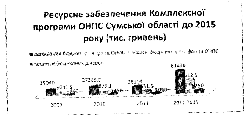
Рис. 2 – Ресурсне забезпечення Комплексної програми охорони навколишнього природного середовища Сумської області до 2015 року

На здійснення Комплексної програми охорони навколишнього природного середовища протягом 2009-2015 років пропонується залучити усього 236694,4 тис. грн., у тому числі: з державного бюджету виділяється 154039,8 тис. грн.; з місцевого бюджету пропонують залучити 69184,6 тис. грн.; кошти не бюджетних джерел – 13470 тис. грн.