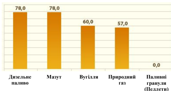
Рисунок 2 – Вміст вуглекислого газу у викидах при спалюванні різних видів палива, % [4]

Багато вчених пов'язують зміни клімату із проблемою так званого «парникового ефекту», тобто накопиченням надлишкової концентрації парникових газів (вуглекислого газу) в атмосфері, як результату життєдіяльності людства.