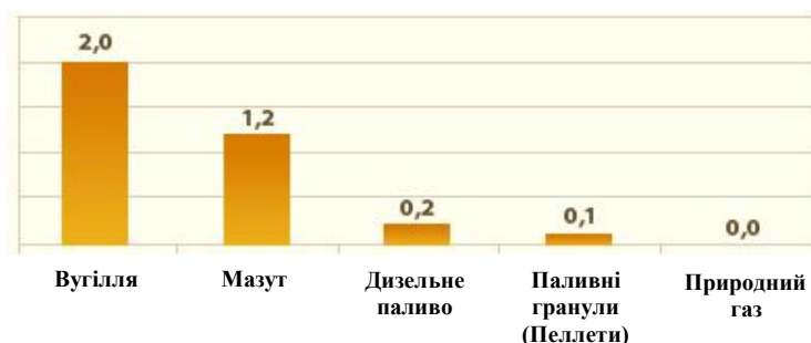
Рисунок 3 – Вміст сірки у викидах при спалюванні різних видів палива, % [4]

Основними джерелами викидів вуглекислого газу, при цьому, є технології, що використовують спалювання традиційних видів палива (мазуту, вугілля), а також автомобільний, морський, авіа й залізничний транспорт, які працюють на бензині, гасі або дизелі. На рисунках нижче наведені дані по вміст вуглекислого газу й інших шкідливих речовин у викидах при спалюванні різних видів палива.