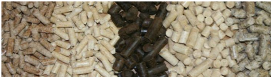
Рисунок 1 – Зовнішній вигляд гранульованого біопалива (пеллет) [2]

ще протягом 2002 року було встановлено більше 5000 котлів, що працюють на пеллетах. У Північній Рейн-Вестфалії (Німеччина) до 2006 року уряд цієї землі замінив 500 тис. застарілих котлів на біопаливні. Роста кількість виробників автоматичних котлів, що працюють на пеллетах. Зараз їх налічується близько 50-ти у всій Німеччині, у 1998 році їх було всього три. Кожен третій встановлюваний у цій країні котел – деревний. За даними Інституту енергетики й охорони навколишнього середовища ФРН, на 2007 рік у Німеччині вже працювало більше 1 млн. котлів і печей на паливних гранулах. Щорічна витрата пеллет склала близько 4 млн. тон [3].