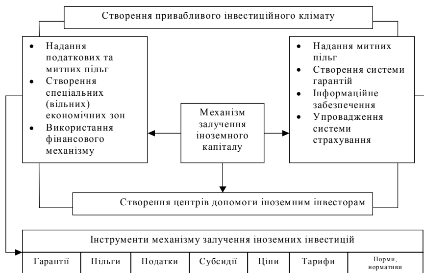
Рисунок 3 – Механізм залучення іноземних інвестицій

Розглядаючи складові представленого механізму, необхідно виділити систему податкових і митних пільг, до яких відносяться: «податкові канікули», зниження ставок оподаткування в разі реінвестування отриманого прибутку чи інвестування у певні регіони та галузі, захист від подвійного оподаткування, а також звільнення від митних зборів на імпорт новітніх машин та обладнання, технологій, ноу-хау, експорту продукції власного виробництва для покриття валютних витрат або зменшення цих зборів.