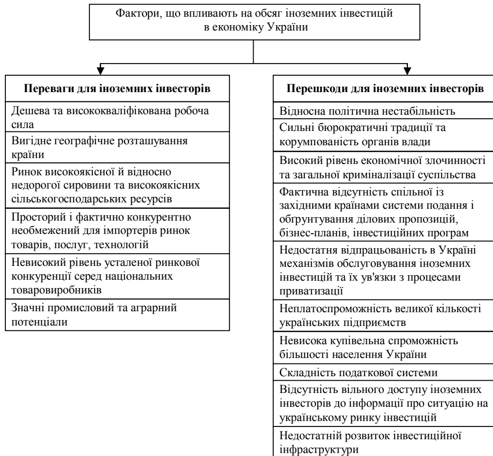
Рисунок 1 – Фактори, що впливають на обсяг іноземних інвестицій в економіку України

Усе це приводить до необхідності створення в країні привабливих умов для іноземних інвесторів та формування ефективного механізму залучення іноземного капіталу.