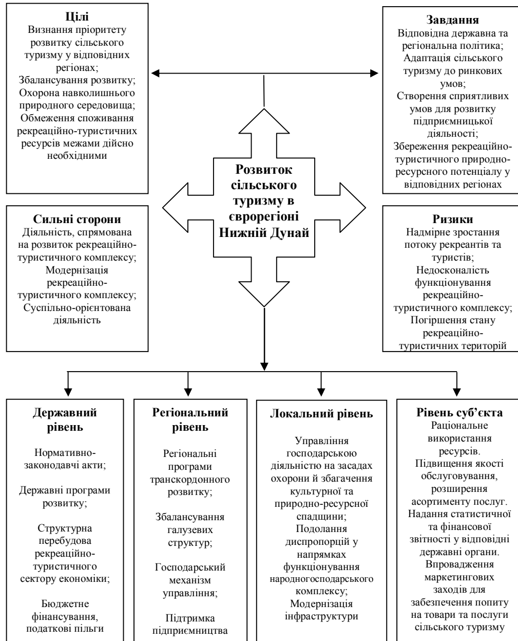
Рис. 2. Цільова модель механізму розвитку сільського туризму в євро регіоні Нижній Дунай

На нашу думку, запропонована модель механізму дає можливість зосередити цільові установки розвитку сільського туризму на чотирьох рівнях управління: державному,