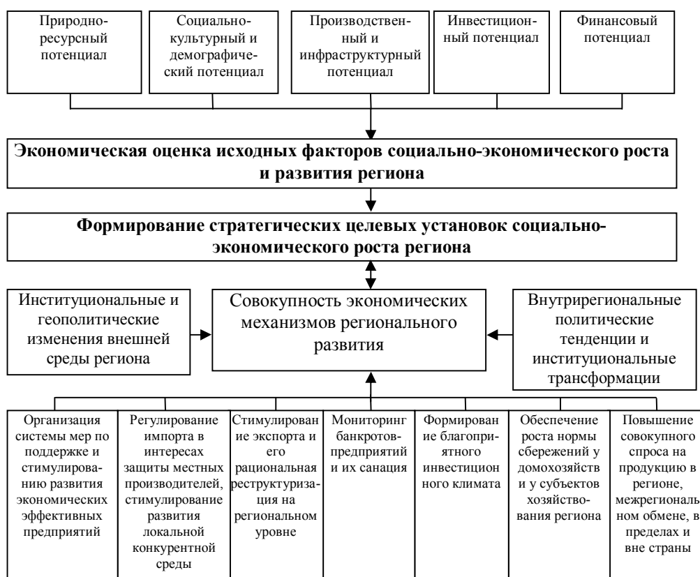
Рис. 1. Структура основных задач региональной экономической политики

Существующее состояние и уровень социально-экономического развития позволяют определить ключевые задачи в области структурной экономической политики региона, выделить те из них, решение которых позволит перейти к стабилизации темпов регионального развития (рис. 1).