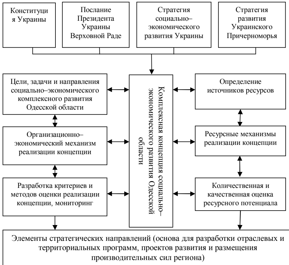
Рис. 3. Организационно-методическая и структурная схема долгосрочной концепции стратегического комплексного социально-экономического развития Одесской обл.

количества факторов в исследуемый комплекс, поскольку чем большее количество их исследуется, тем точнее будут результаты.