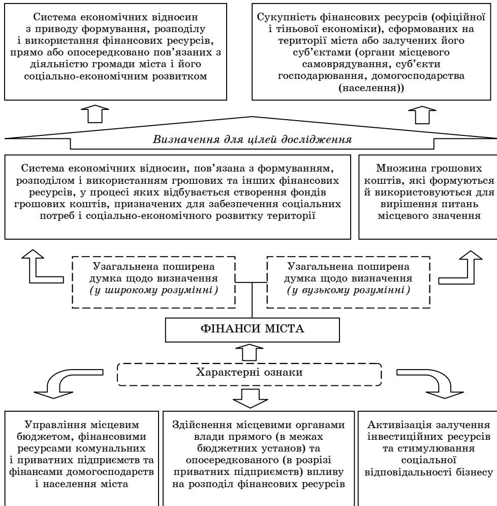
Рисунок 2 - Формування виокремленого підходу до визначення сутності фінансів міста

метою економічного і соціального розвитку території. Таким чином, характерні цій категорії особливості полягають у такому: всеохоплююче управління фінансовими ресурсами комунальних і приватних підприємства та фінансами домогосподарств і населення міста; здійснення місцевими органами влади прямого (в межах бюджетних установ) та опосередкованого (в розрізі приватних підприємства) впливу на розподіл фінансових ресурсів; активізація залучення інвестиційних ресурсів та стимулювання соціальної відповідальності бізнесу (рис. 2).