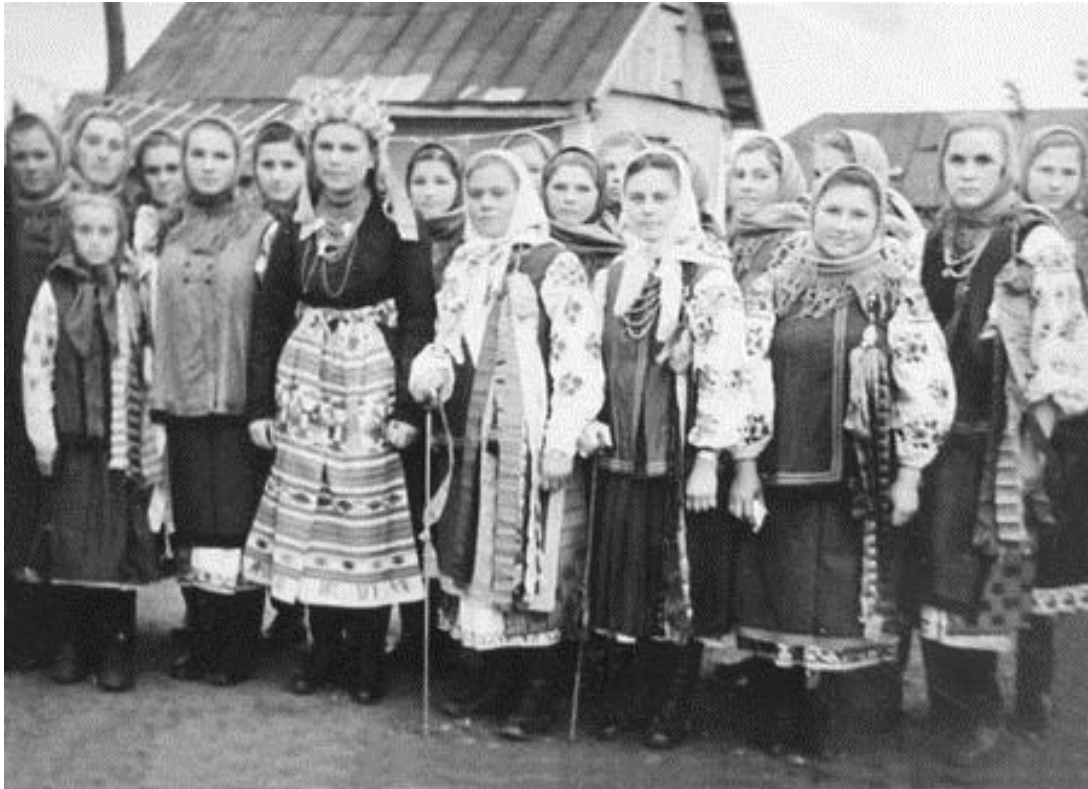
Обряд весілля на Конотопщині

На Конотопщині атрибутами сватання та весільного обряду були хліб, рушники, гарбуз. Якщо дівчина погоджувалася йти під вінець, сватів пригощали хлібом та пов'язували їх рушниками. Якщо хлопець не підходив, свати отримували гарбуза. Традиційно господарі вихвалялися достатком своєї родини, показували все, що мали. Якщо молодята підходили один одному, сватів щедро пригощали.