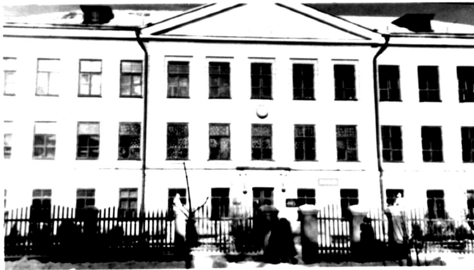
Фасад середньої школи № 11 м. Конотопа. 1963 р.

У 1960 році заклади освіти привокзального району були передані на баланс Сумському управлінню освіти і знову відбулася їх перереєстрація під новими порядковими номерами: школа № 77 на № 11.