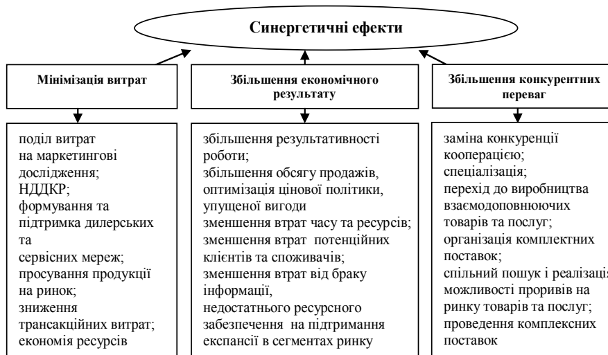
Рисунок 2 – Синергетичні ефекти маркетингових інновацій системної діяльності окремих підприємств

У результаті отримання позитивного синергетичного ефекту можна очікувати підвищення інвестиційної привабливості, а це забезпечить залучення капіталу, поліпшення менеджменту та зростання вартості активів підприємства [14].